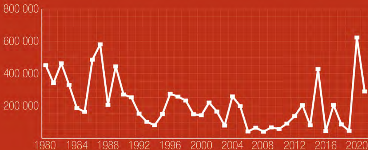
Figure 1 : Membres syndiqués touchés par des arrêts de travail, Canada, 1980-2021

Aux États-Unis, où les taux de syndicalisation sont parmi les plus bas au monde, la faveur du public à l'égard des syndicats a atteint des sommets jamais vus depuis 1965. Au Canada et ailleurs, un nouveau souffle de militantisme chez les travailleurs face aux problèmes persistants de sécurité au travail, aux salaires continuellement bas et à l'inflation élevée en incite d'autres à exiger mieux de leurs employeurs et à faire le piquet de grève si nécessaire. En 2020, un nombre encore plus élevé de travailleuses et travailleurs au Canada étaient touchés par des conflits de travail (grèves et lock-out) qu'à n'importe quel moment depuis 1976.